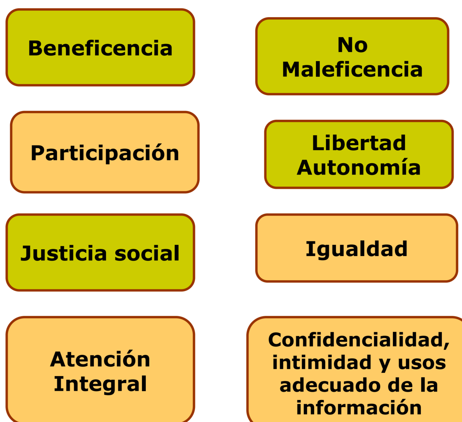
Fig. 2: Principios éticos en Intervención Social.

En Bioética el método deliberativo más comúnmente aceptado para la resolución de conflictos éticos, es el Método de Deliberación Moral , que debe constar siempre de unos pasos básico