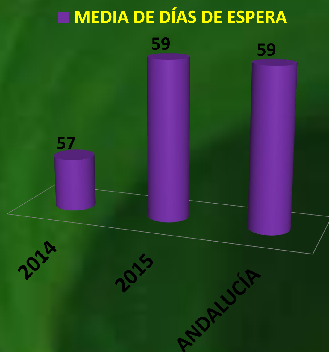
TIEMPO MEDIO DE RESPUESTA QUIRÚRGICA EN ANDALUCÍA