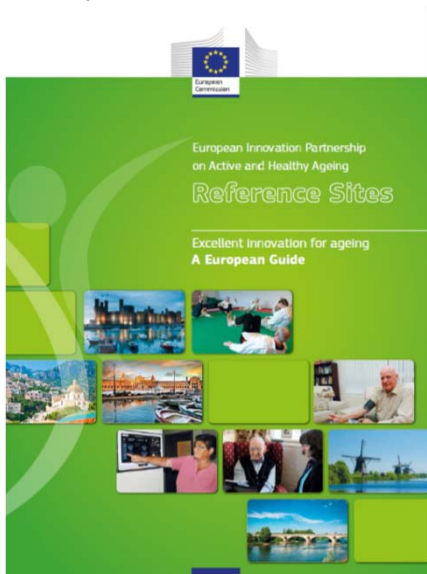
Fig. 3: Informe de "Reference Sites" europeos para la innovación en EIP-AHA

El Plan de implementación estratégica de la EIP on AHA ha definido 3 áreas prioritarias de trabajo : 1.- Prevención y promoción de la salud. 2.- Curar y cuidar. 3.- Vida independiente para las personas mayores 8 .