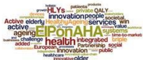
Fig. 2: Nube de la European Innovation Partnership on Active and Healthy Ageing (EIP on AHA)