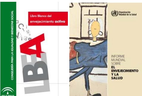
Fig. 1: Libro blanco del EA de Andalucía 5 e informe de la OMS sobre Envejecimiento y la Salud 7 .

Así mismo, en el recientemente publicado Informe Mundial sobre el Envejecimiento y la Salud , se define el EAS como el proceso de fomentar y mantener la capacidad funcional que permite el bienestar en la vejez 7 .